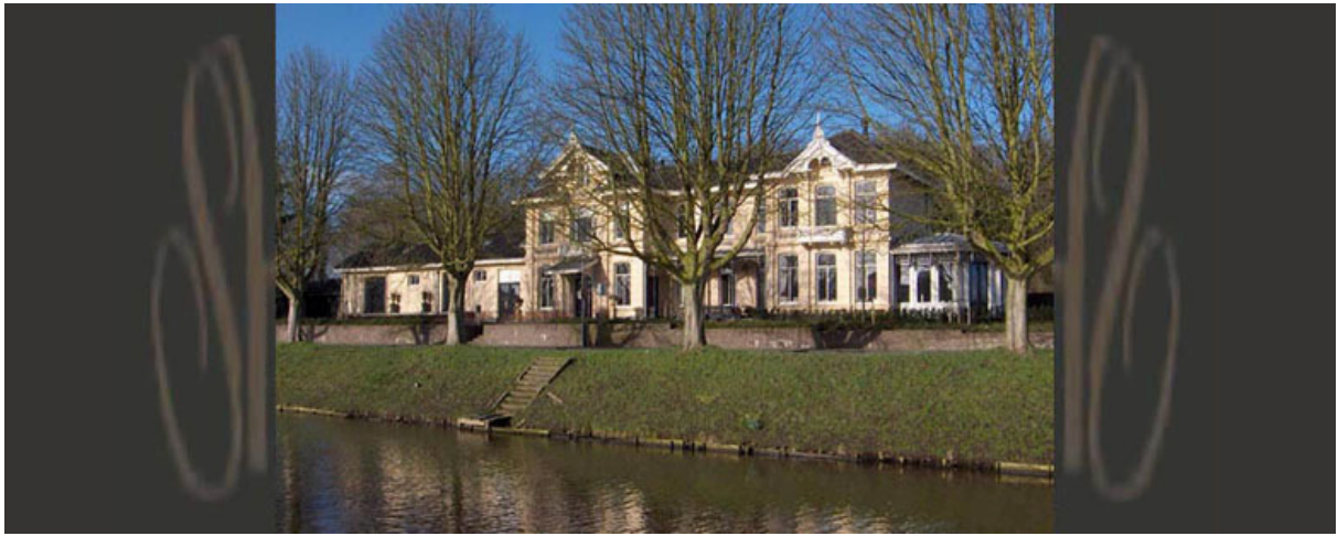
Het Schouwspel – Woonstation – Koridon Interieur